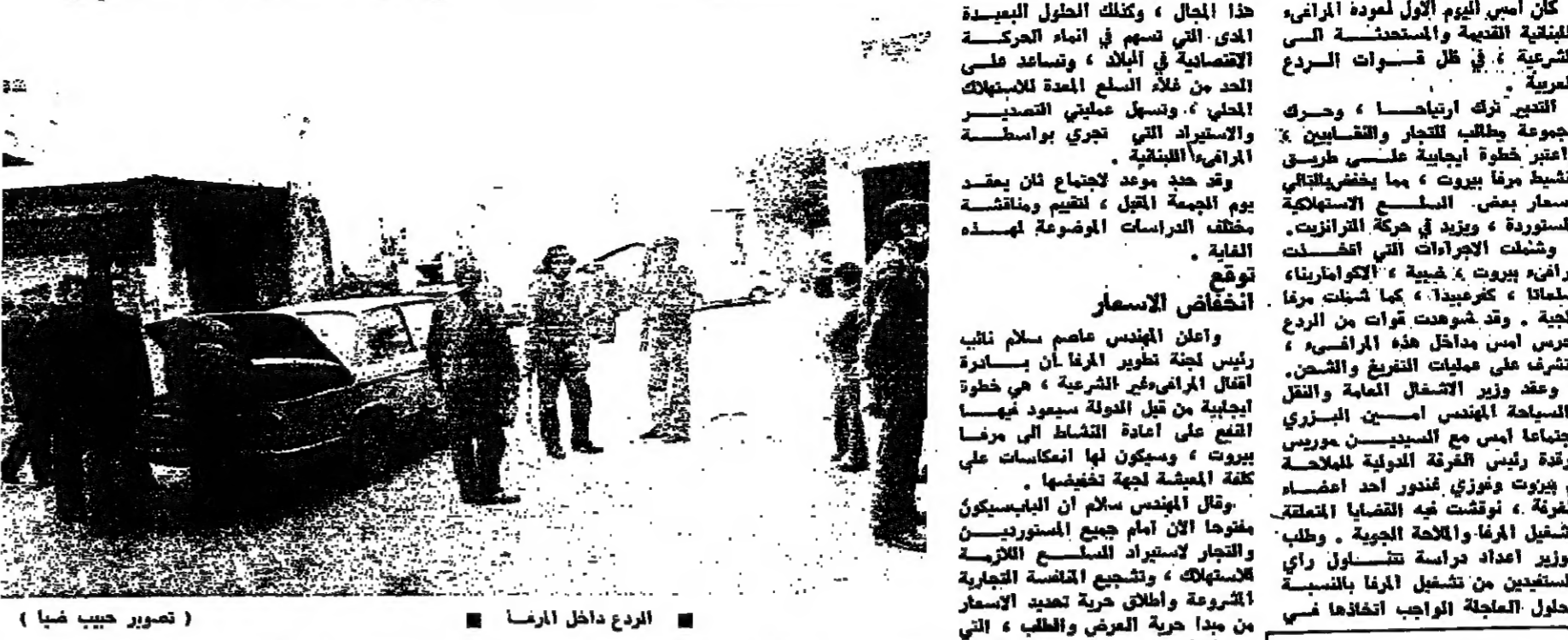
الذرع داخل المرفأ ■